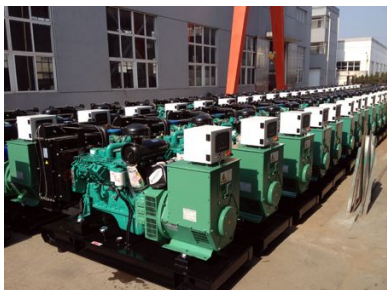
东南亚客户100台康明斯发电机组