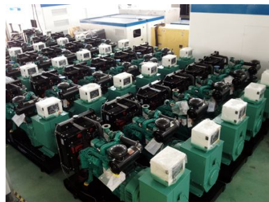
巴基斯坦 50台康明斯发电机组