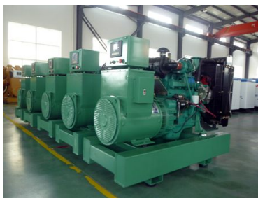
出口安哥拉5台康明斯发电机组