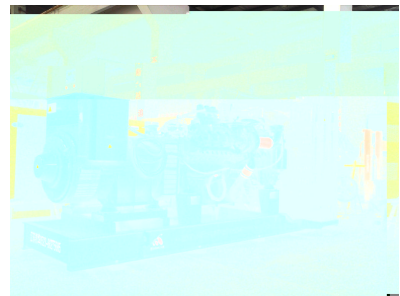
出口巴基斯坦 800KW MTU发电机组