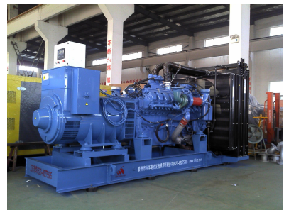
出口巴基斯坦 800KW MTU发电机组