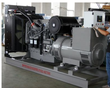
出口伊朗 500KW珀金斯发电机组