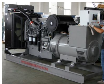
出口伊朗 500KW珀金斯发电机组