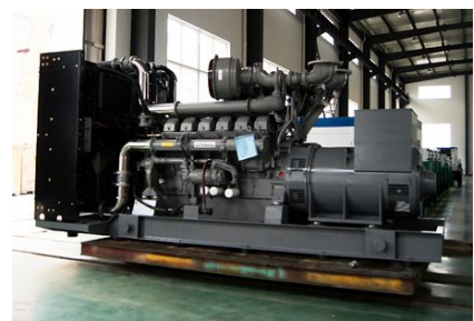
出口巴基斯坦 1250KW珀金斯发电机组