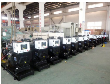
出口坦桑尼亚 20台珀金斯发电机组