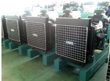
出口到非洲20台68KW沃尔沃机组