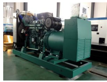
中国黄金集团金矿500KW沃尔沃机组