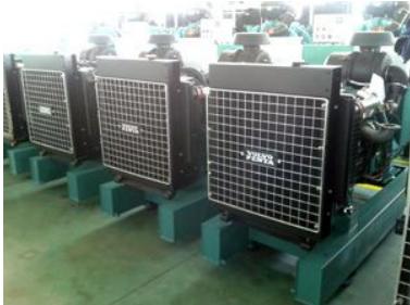
出口到非洲20台68KW沃尔沃机组