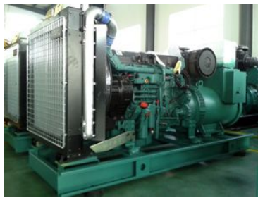
中国中汽集团10台沃尔沃机组